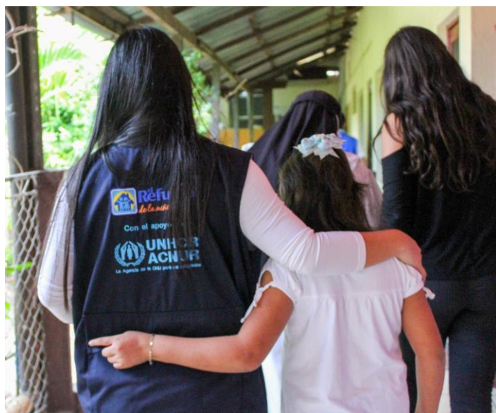
ACNUR con organizaciones socias como Refugio de la Niñez y la Iglesia Católica brindan acompañamiento integral a niñez con necesidades de protección internacional. Foto tomada en la Casa Hogar Santo Domingo en Santa Elena, Flores, Petén.

A través de alianzas como la reciente firma de la Carta de Entendimiento entre ACNUR y el Consejo Nacional de la Juventud (CONJUVE) , institución rectora en los asuntos y políticas públicas a favor de la juventud, se promueve la inclusión de jóvenes refugiados en las políticas nacionales.