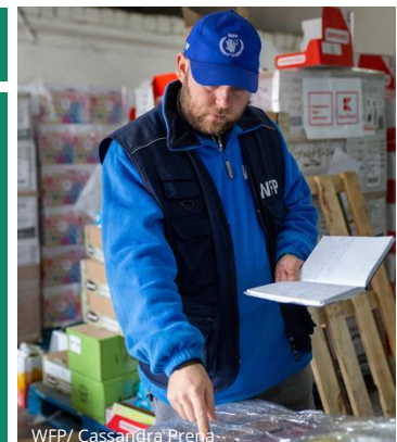
WFP/ Cassandra Prena