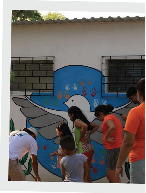
* Nombre cambiado por motivos de protección.