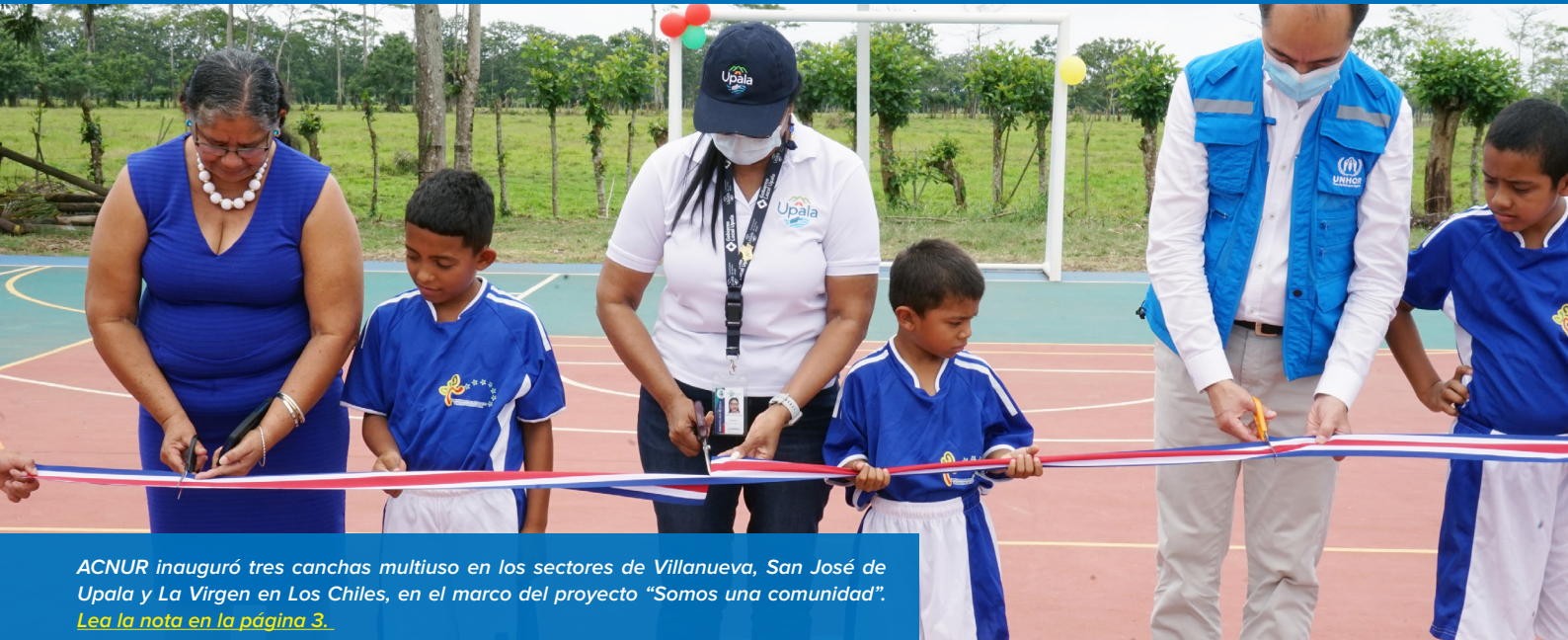
ACNUR inauguró tres canchas multiuso en los sectores de Villanueva, San José de Upala y La Virgen en Los Chiles, en el marco del proyecto “Somos una comunidad”. Lea la nota en la página 3.