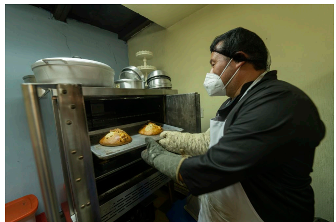
ACNUR, junto a su socio La Alianza, inauguró y equipó una escuela de panadería en Villa Nueva.

La inclusión laboral es uno de los métodos más sostenibles para apoyar a que las personas de interés de ACNUR puedan alcanzar su autosuficiencia. ACNUR trabaja bajo una metodología que busca preparar a la población para aprovechar las oportunidades del mercado laboral del país, incluyendo estudios de demanda laboral, fortalecimiento de habilidades para la vida, capacitaciones vocacionales y técnicas, reconversión de perfil laboral, pasantías empresariales, aprendizaje basado en el trabajo, intermediación laboral y acompañamiento psicosocial.