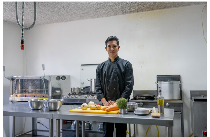
Refugiado participante del programa de pasantías empresariales.