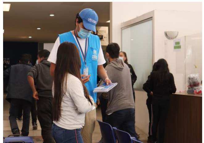
Identificación de necesidades de Protección a Retornados en Fuerza Aérea Guatemala

*Datos actualizados a septiembre de 2022