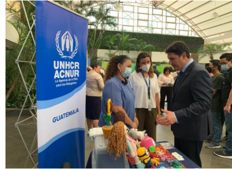
Feria de emprendimiento organizada por la Municipalidad de Guatemala.