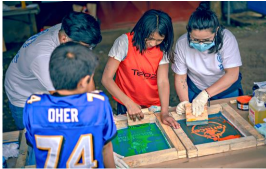
Feria de convivencia pacífica en el Municipio de Villa Nueva.