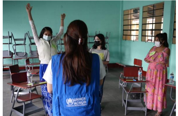
Actividad de retroalimentación con las comunidades.