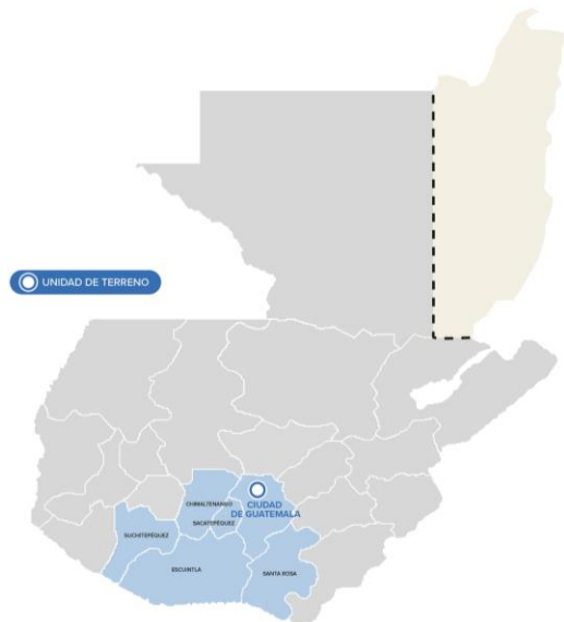
Personas refugiadas y solicitantes de esa condición en el área de responsabilidad

La oficina asiste casos con necesidades de protección internacional en el Aeropuerto Internacional la Aurora y en el Centro de Retornados. La respuesta de protección y soluciones se da con el apoyo de los socios que brindan albergue, asesoría legal, psicosocial y soluciones duraderas.