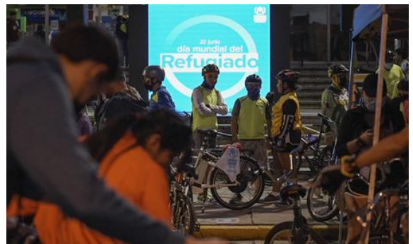
Bici Tour Día Mundial del Refugiado 2022.