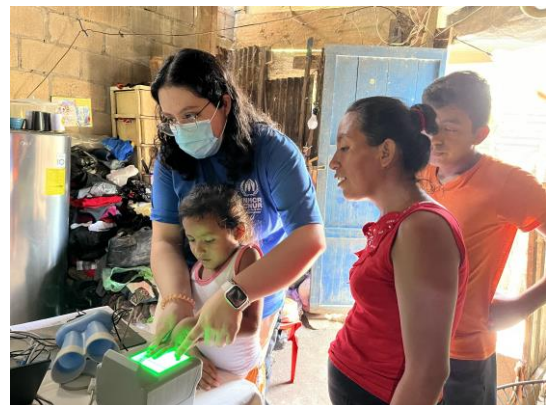
Visitas domiciliarias de protección y toma de medidas biométricas, Catarina San Marcos. ©ACNUR/ 2022

*Datos actualizados a septiembre de 2022