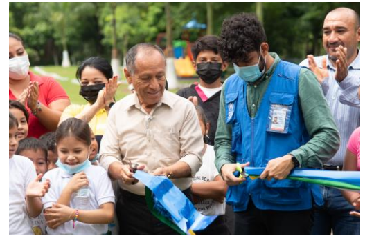
Inauguración del parque ecológico Ayutla Explorer.