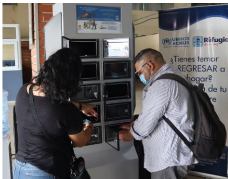
Estación de carga de teléfonos en el Centro de Retornados de Tecún Umán.