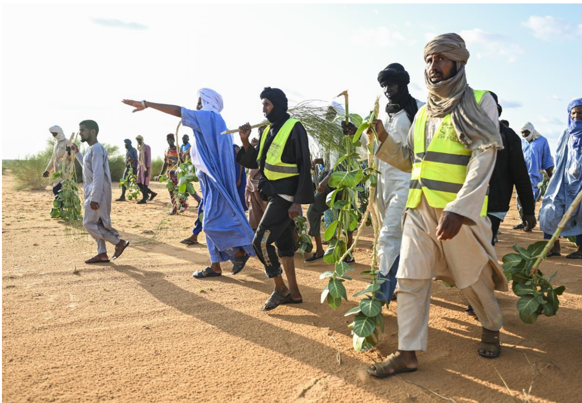
Mauritanie. La Brigade Anti-Feu récompensée pour son activisme environnemental. 25 juillet 2022.