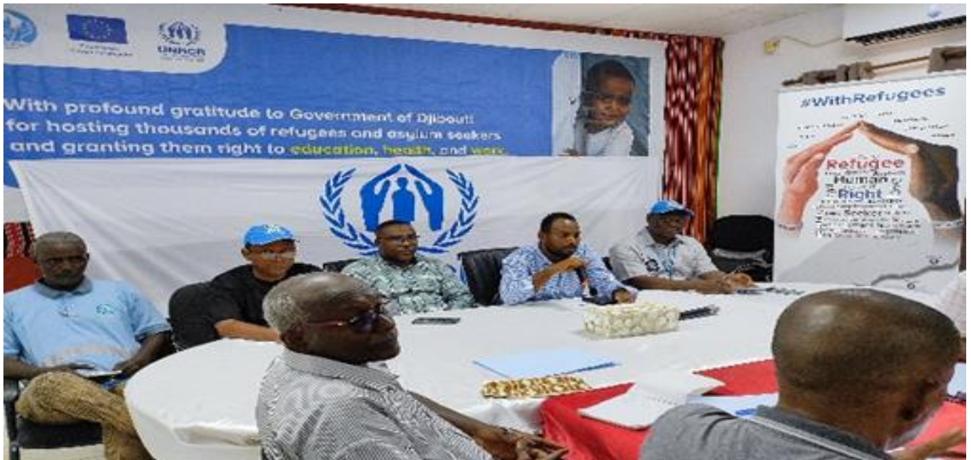
Atelier de formation pour les forces de l'ordre et de sécurité (Police et Gendarmerie Nationale) de la région d'Obock

Enfin, la période sous revue a également été marquée par la tenue de différents ateliers et formations conduits par le HCR en collaboration avec l'ONARS, au sujet de volets clés de la Protection Internationale et sur la dissémination de la Loi portant sur le Statut des Réfugiés en République de Djibouti. Ces ateliers ont pu être tenus grâce au financement de l'Union Européenne et qui avaient pour but de renforcer les capacités des agents des forces de l'ordre sur le cadre légal de protection et d'inclusion des réfugiés et des demandeurs d'asile à Dikhil, Ali Sabieh et Markazi.