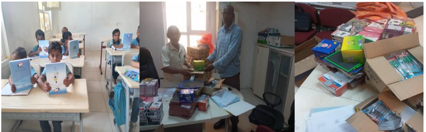
Distribution des manuels et de kits scolaires aux élèves de Markazi