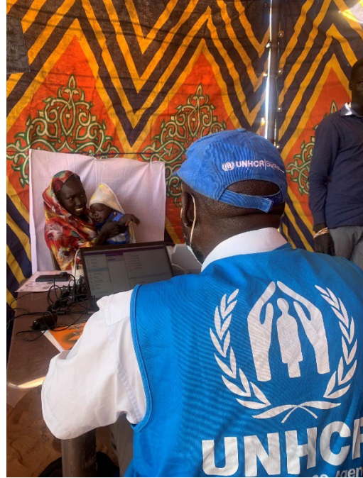
رسم توضيحي 1: امرأة لاجئة من جنوب السودان يجري التحقق منها في اللعيط بشمال دارفور

عملية التحقق وتسجيل اللاجئين الحيوية (اليومتري) المشتركة من قبل معتمدية اللاجئين ومفوضية الأمم المتحدة لشؤون اللاجئين جارية في اللعيط، شمال دارفور. للمتابعة ستتواصل عمليات التحقق والتسجيل في شرق وجنوب دارفور. بدأت عملية التسجيل في وقت مبكر من هذا العام في وسط دارفور، حيث يقيم اللاجئون من تشاد وجمهورية إفريقيا الوسطى. يعد التسجيل الحيوي أداة حماية مهمة، حيث يضمن حصول اللاجئين على حقوقهم الأساسية والمساعدة الإنسانية ومنع حدوث حالات انعدام الجنسية.