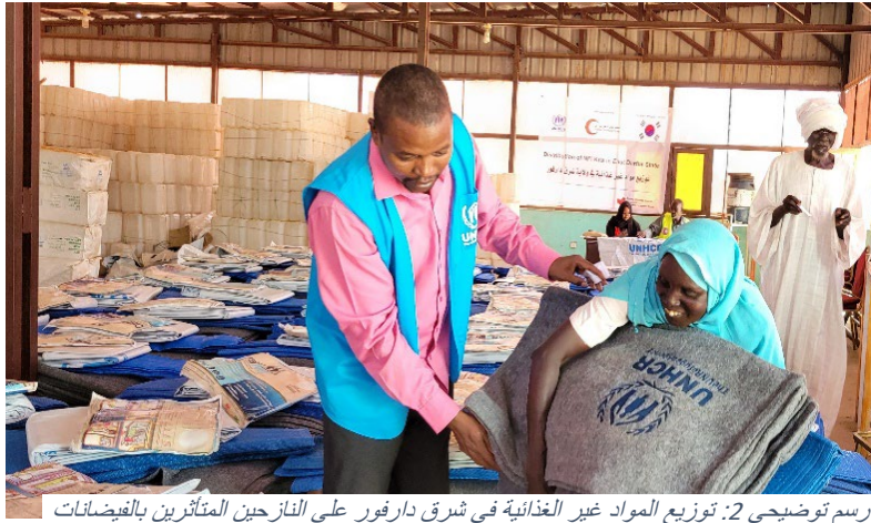
الرسم توضيحي 2: توزيع المواد غير الغذائية في شرق دارفور على النازحين المتأثرين بالفيضانات

مشاريع الدعم المجتمعي في دارفور: قامت المفوضية، من خلال شريكها منظمة العمل الإنساني الأفريقي (AHA)، بتجديد غرفة الجراحة في مستشفى الفاشر للعيون وشيدت غرف إضافية. سيستفيد 25,000 شخص من جميع أنحاء دارفور من المرفق المحسن. بالإضافة إلى ذلك، قامت منظمة العمل الإنساني الأفريقي بترميم وتوسيع 5 مدارس وتم تسليمها إلى وزارة التربية والتعليم. ستعمل المدارس على تحسين الوصول إلى التعليم للنازحين والمجتمع السوداني المضيف في الفاشر.