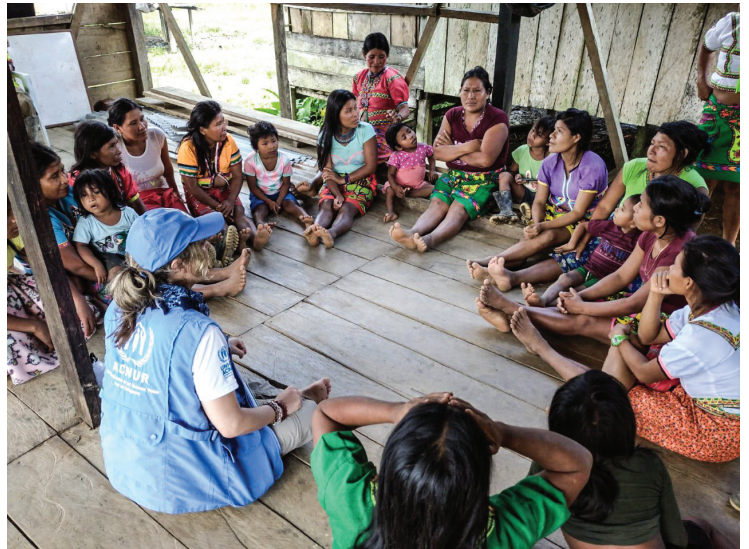
Visita a la comunidad indígena Emberá Dóbida en Murindó, Antioquia. ACNUR Colombia

A través de sus oficinas de terreno, el ACNUR ha adelantado acciones de acompañamiento y apoyo en materia de soluciones con enfoque étnico y comunitario en Putumayo, Nariño, Caquetá, Meta, Chocó, entre otros (ver mapa 1 - figura 2).