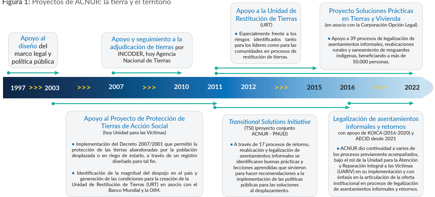
Figura 1: Proyectos de ACNUR: la tierra y el territorio