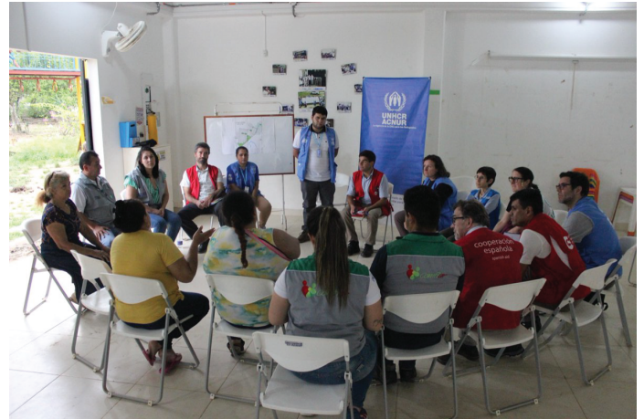
Visita a la comunidad del barrio legalizado Bello Horizonte, Arauca. ACNUR Colombia

Para mejorar la sostenibilidad de las soluciones, los equipos del ACNUR han promovido que en los procesos de soluciones también se desarrollen proyectos productivos para la generación de ingresos o el acceso a medios de vida para las comunidades desplazadas . Por ejemplo, la organización ha apoyado a la Unidad Administrativa del Servicio Público de Empleo (UAESPE) en el diseño y fortalecimiento de la ruta de empleabilidad (aplicación, orientación, remisión, colocación) con enfoque de cierre de brechas orientadas a la población víctima del conflicto armado, incluida la población desplazada (80% de atendidos han sido desplazados).