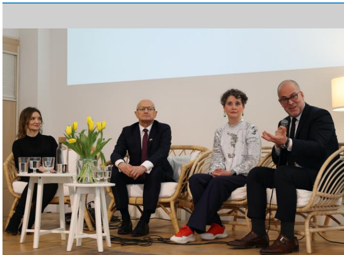
Otwarcie Centrum Społeczności Uchodźców „Baobab” w Lublinie. 28 lutego 2023 r.

133 pracowników międzynarodowych i krajowych 5 biur (2 w Warszawie, 1 w Krakowie, 1 w Rzeszowie i 1 w Lublinie)