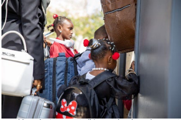
لاجئون في طريقهم إلى مطار معيثة للمغادرة نحو مركز العبور الطارئ في رومانيا.

في 31 مايو، غادر ليبيا أكثر من 100 لاجئ متجهين إلى مركز العبور الطارئ في رومانيا، وذلك بدعم لوجستي من المنظمة الدولية للهجرة. في مركز العبور الطارئ، ستستكمل إجراءات المجموعة التي ضمت أفراداً من السودان وإريتريا وسوريا وجنوب السودان والصومال واليمن، وذلك لإعادة توطينهم في النرويج. منذ عام 2017، أعادت المفوضية توطين أكثر من 3,400 لاجئ في أوروبا وكندا وأستراليا. تعرب المفوضية عن امتنانها للسلطات الليبية ذات الصلة على دعمها في تسهيل الإجراءات اللازمة لعمليات المغادرة هذه، وتواصلت مع البلدان على توفير المزيد من المسارات القانونية لمساعدة طالبي اللجوء واللاجئين الذين يعانون من مخاطر حماية شديدة على الوصول إلى بر الأمان خارج ليبيا.