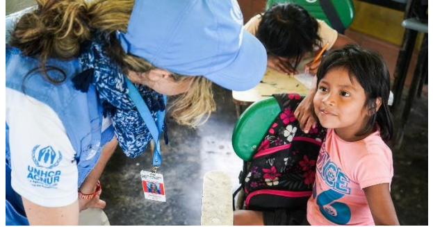
Comunidad indígena de Ñarangué, Antioquia.