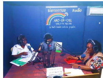
Emission radio de sensibilisation sur l'apatridie à Abobo, Abidjan