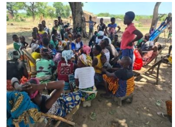
Focus group dans le village de Bibièldou (Bouna) pour l'identification des migrants à risque d'apatridie