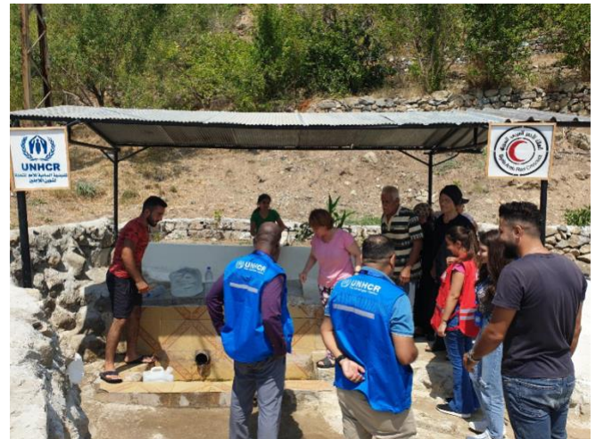
موظفو المفوضية وشريكها في زيارة متابعة لمبادرة مجتمعية تم استكمالها في رأس البسيط، بريف محافظة اللاذقية. تهدف المبادرة إلى إعادة تأهيل نبع ماء لدعم حصول أكثر من 200 عائلة (حوالي 1,000 شخص) على مياه الشرب.