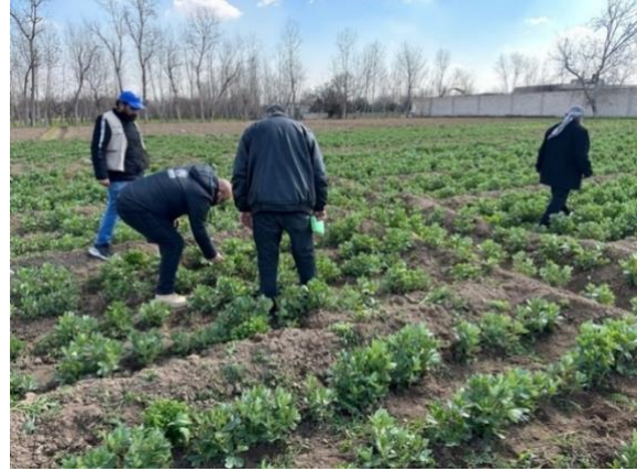
مشروع زراعي تدعمه المفوضية في الغوطة الشرقية، بريف دمشق.

● تقوم المفوضية وشريكها بمحاكاة مشروع النقد مقابل العمل الذي قامت به في مخيم الهول (بمحافظة الحسكة) في مخيم محمودلي (بمحافظة الرقة). سيقدم المشروع فرص العمل للعائلات في المخيم حيث ستحصل على دخل مالي مقابل العمل من خلال إصلاح الخيام واستبدال الأجزاء المفقودة فيها. وقد حصل 27 فرداً في المخيم على النقد مقابل العمل خلال شهر تموز/يوليو.