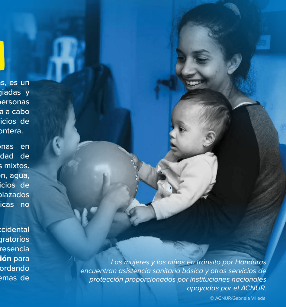
Las mujeres y los niños en tránsito por Honduras encuentran asistencia sanitaria básica y otros servicios de protección proporcionados por instituciones nacionales apoyadas por el ACNUR.

Es probable que la situación en la frontera occidental evolucione con los continuos cambios migratorios regionales. El ACNUR seguirá manteniendo una presencia activa sobre el terreno y un liderazgo de coordinación para apoyar a las personas en movimientos mixtos, abordando tanto las necesidades inmediatas como los problemas de protección a largo plazo.