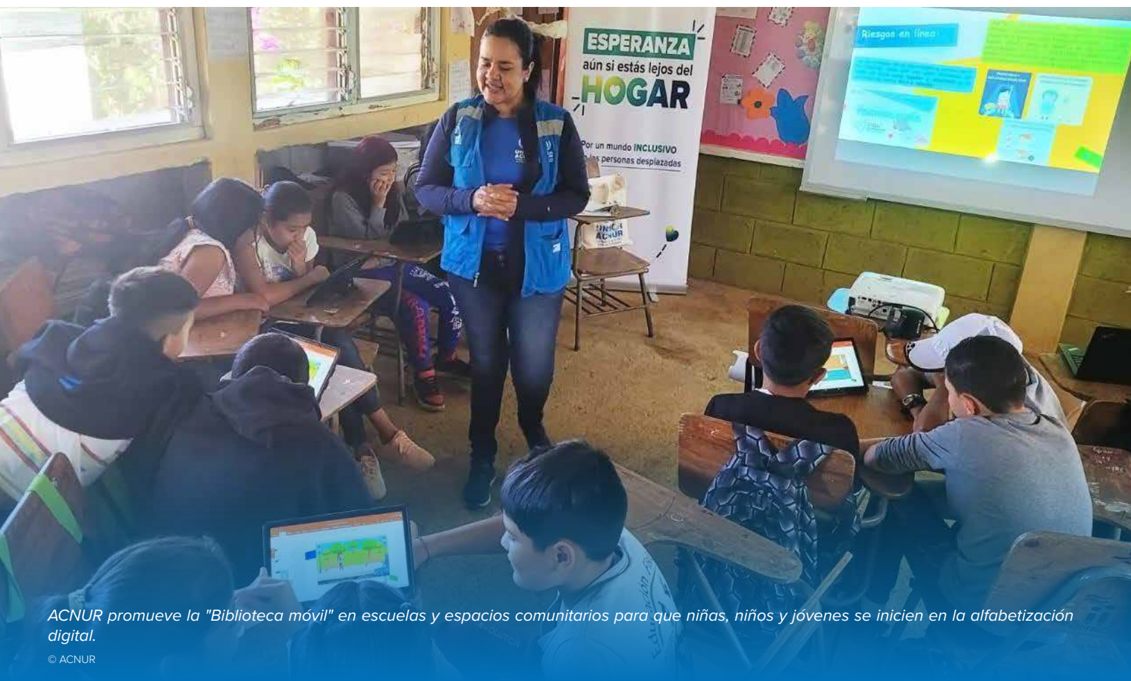
ACNUR promueve la "Biblioteca móvil" en escuelas y espacios comunitarios para que niñas, niños y jóvenes se inicien en la alfabetización digital.

ACNUR ha remitido casos de personas desplazadas internamente o en riesgo de desplazamiento a programas de medios de vida con socios que promueven la protección a través del emprendimiento y pasantías de colocación laboral para jóvenes y con contrapartes en procesos de formación profesional.