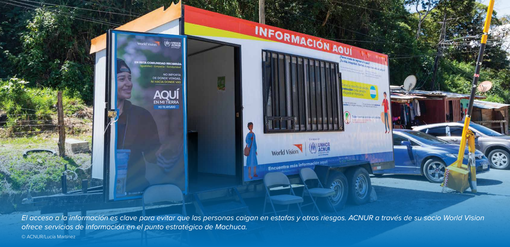
El acceso a la información es clave para evitar que las personas caigan en estafas y otros riesgos. ACNUR a través de su socio World Vision ofrece servicios de información en el punto estratégico de Machuca.