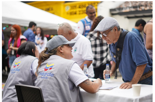
El Centro Intégrate apoya a migrantes, refugiados, retornados y comunidades de acogida para que accedan a empleo, medios de vida y emprendimiento en Medellín, Antioquia.