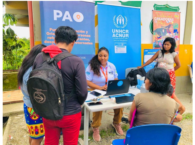
Un Punto de Atención y Orientación (PAO) que recibe a personas que requieren orientación y asistencia en Quibdó, Chocó.