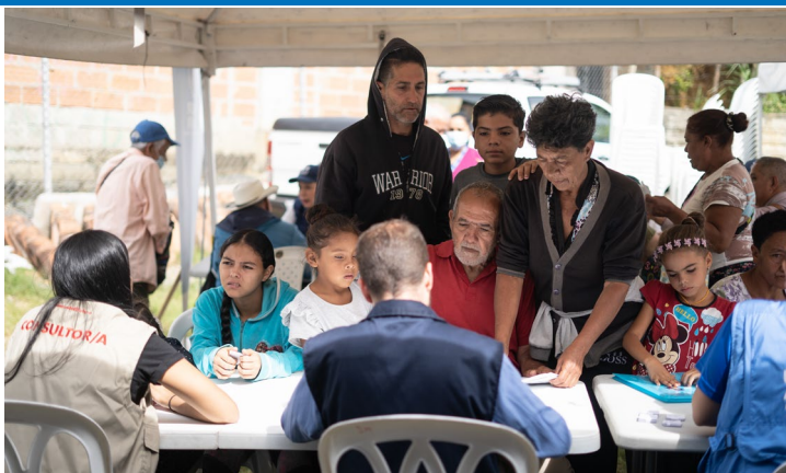
Una jornada de asistencia interinstitucional para que venezolanos puedan acceder al Permiso por Protección Temporal (PPT) en Bello, Antioquia.