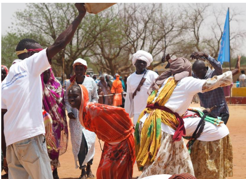
Des réfugiés soudanais exposent un pan de leur culture lors de la Journée mondiale du réfugié à Adré