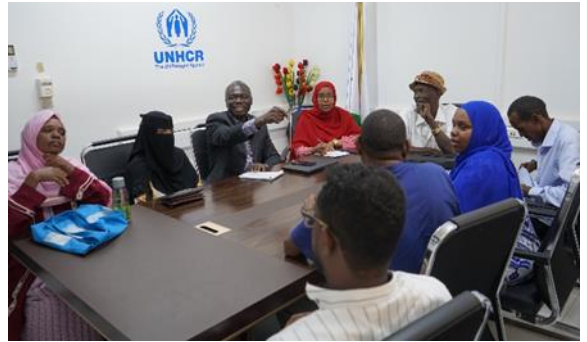
Le HCR a reçu des représentants de réfugiés urbains pour discuter de questions clés de protection

Le HCR lance un processus de rapatriement volontaire pour les réfugiés éthiopiens. Dans le cadre de la recherche de solutions durables, le HCR s'est fixé comme priorité de faciliter le rapatriement volontaire des réfugiés éthiopiens souhaitant rentrer chez eux. Le HCR a commencé une mobilisation communautaire parmi les réfugiés et a contacté l'opération du HCR en l'Ethiopie pour coordonner le processus ensemble et pour obtenir