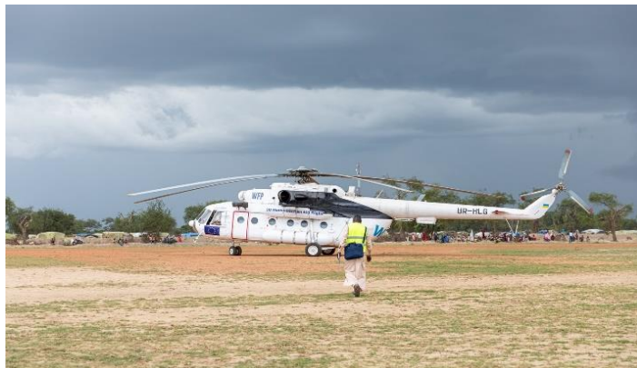
Le HCR avec l'appui d'UNHAS a effectué un pont aérien humanitaire à Goz-Amir, à l'est du Tchad pour fournir une aide d'urgence aux familles affectées par les inondations.

Avec l'appui du Service aérien humanitaire des Nations Unies (UNHAS), le HCR a acheminé par avion des articles de première nécessité aux familles réfugiées affectées par les inondations à Goz-Amir, à l'est du Tchad. Plus de 5 700 familles affectées ont reçu des kits comprenant des moustiquaires, du savon, des jerricans, des nattes, des seaux et des bâches en plastique. Dans le site aménagé de réfugiés à Goz-Amir, les pluies diluviennes et les inondations ont endommagé plus de 6 000 abris et 292 latrines.