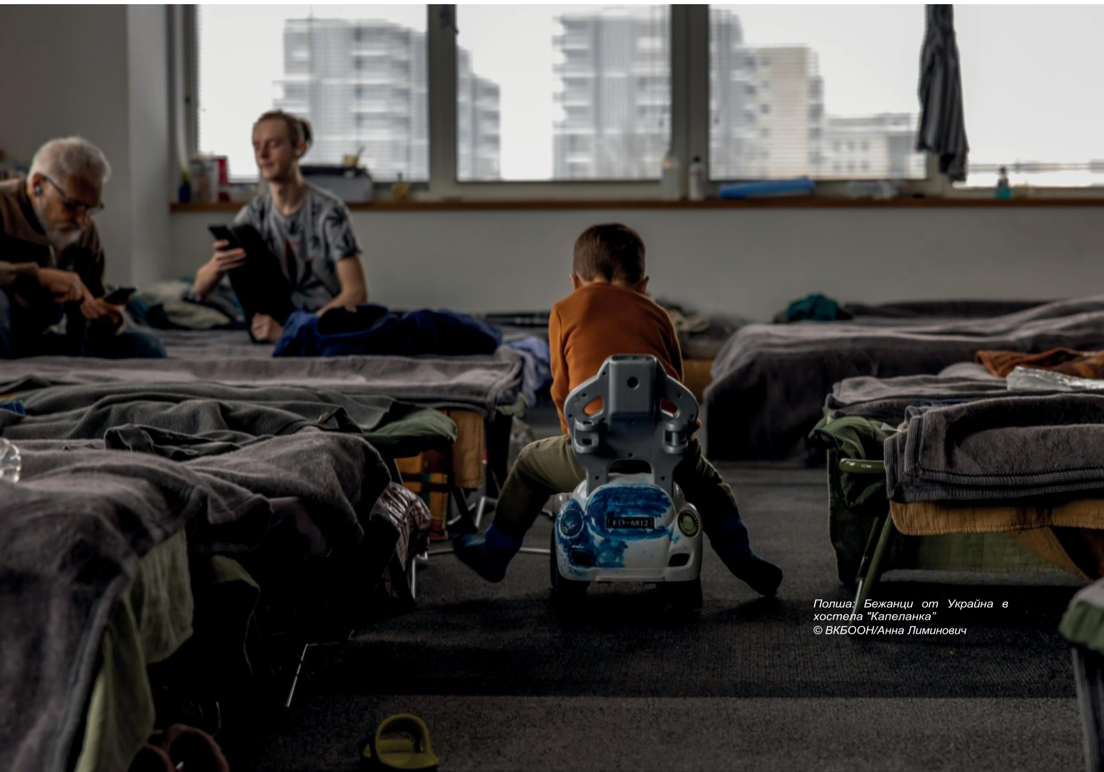
Полша: Бежанци от Украйна в хостела "Капеланка"

КБМ може да се използва и за координиране на действията с участници в мирния процес, включително регионални организации, национални правителства, гражданско общество, активисти, лидери на общности и други агенции на ООН в съответните сектори, за да се гарантира включването на бежанците в инициативите за социално сближаване и мирно съвместно съществуване, както и в процесите на миротворчество и изграждане на мира, които се случват в техните страни на произход.