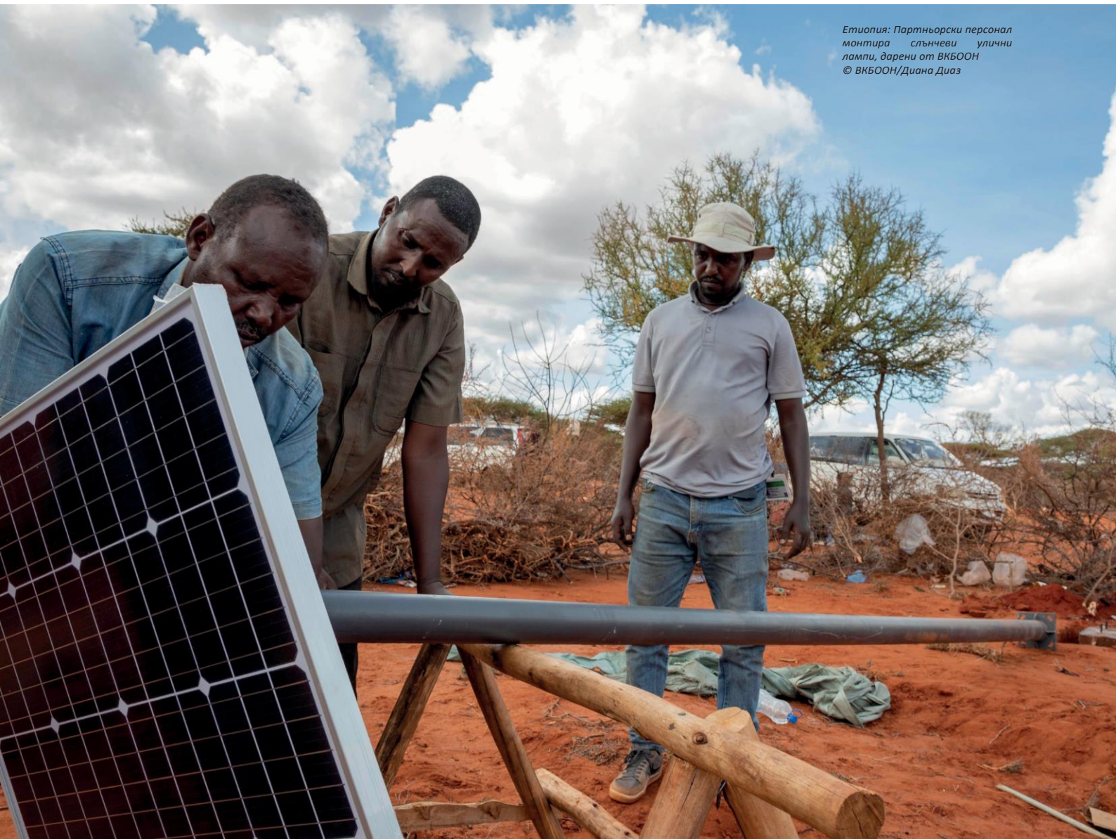
Етиопия: Партньорски персонал монтира слънчеви улични лампи, дарени от ВКБООН