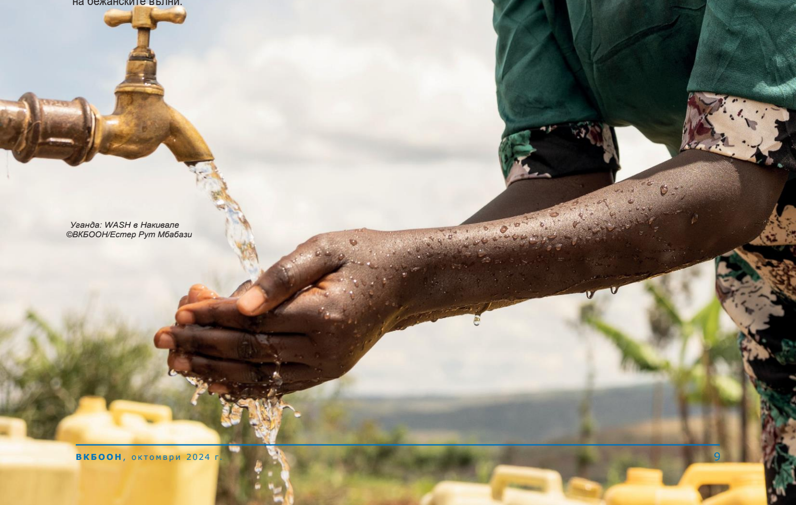
Уганда: WASH в Накивале