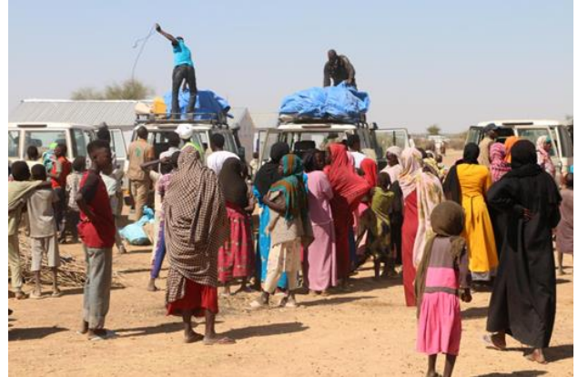
Relocalisation des nouveaux arrivés du site spontané d'Adré vers le site aménagé de Dougi, province du Ouaddai.

Du 23 décembre 2024 au 5 janvier 2025, un total de 1 311 réfugiés soudanais sont arrivés au Tchad. Le Haut-Commissariat des Nations Unies pour les réfugiés (UNHCR), la Commission Nationale pour l'Accueil et la Réinsertion des Réfugiés et des Rapatriés (CNARR) et la Croix Rouge du Tchad surveillent activement les frontières en réponse à une augmentation potentielle du nombre de réfugiés Soudanais. Depuis avril 2023, début de la crise au Soudan, 723 951 réfugiés ont été dénombrés au Tchad, dont 238 170 en 2024. La poursuite des violences au Soudan pourrait contraindre jusqu'à 250 000 réfugiés supplémentaires à fuir vers le Tchad en 2025.