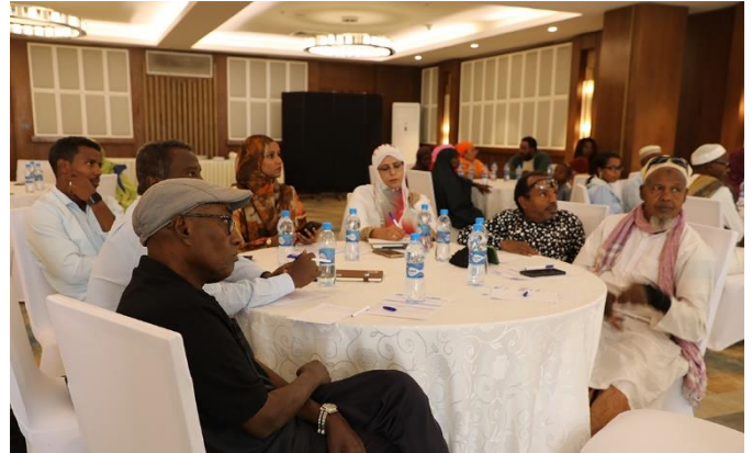
L'Agence Nationale pour les Personnes vivant avec Handicaps (ANPH) a tenu un atelier pour la restitution des résultats de l'étude sur les besoins des réfugiés vivant avec handicap

Le 27 janvier, la ministre de la Solidarité Sociale, S.E. Mme Ouloufa Ismail Abdo, a mené la dernière étape de la semaine de Solidarité Nationale dans la région d'Obock. La ministre a visité le site de réfugiés de Markazi, qui accueille plus de 2 500 réfugiés et demandeurs d'asile, et s'est entretenu avec des réfugiés yéménites et érythréens hébergés sur le site depuis 2015. La semaine de la Solidarité Nationale a été lancée le 6 janvier pour réaffirmer l'engagement du gouvernement à construire un Djibouti plus uni, plus inclusif et plus résilient.