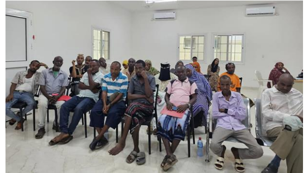
Le HCR et ses partenaires sensibilisent les réfugiés et demandeurs d'asile suite à la déclaration du ministre de l'intérieur djiboutien de la nouvelle stratégie politique

Le 13 avril, toutes les agences des Nations Unies opérant à Djibouti se sont réunies pour discuter de la marche à suivre, car l'impact des réductions de financement sur la santé des communautés vulnérables est de plus en plus grave. Des agences telles que l'UNICEF et le PAM, qui s'occupent à Djibouti de la santé, de la nutrition et de l'immunisation des réfugiés, ont annoncé que la réduction de leurs budgets aurait de graves conséquences pour les populations vulnérables d'accueil et de réfugiés. Les agences de l'ONU suivent de près la situation et travaillent en collaboration avec le ministère pour éviter un tel scénario. Toutes les agences ont accepté de travailler ensemble pour trouver d'autres solutions possibles.