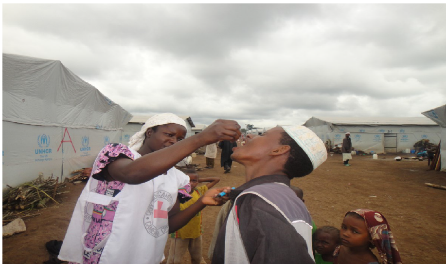
Un agent vaccinateur administre le vaccin contre la polio aux réfugiés sur le site de Lolo.