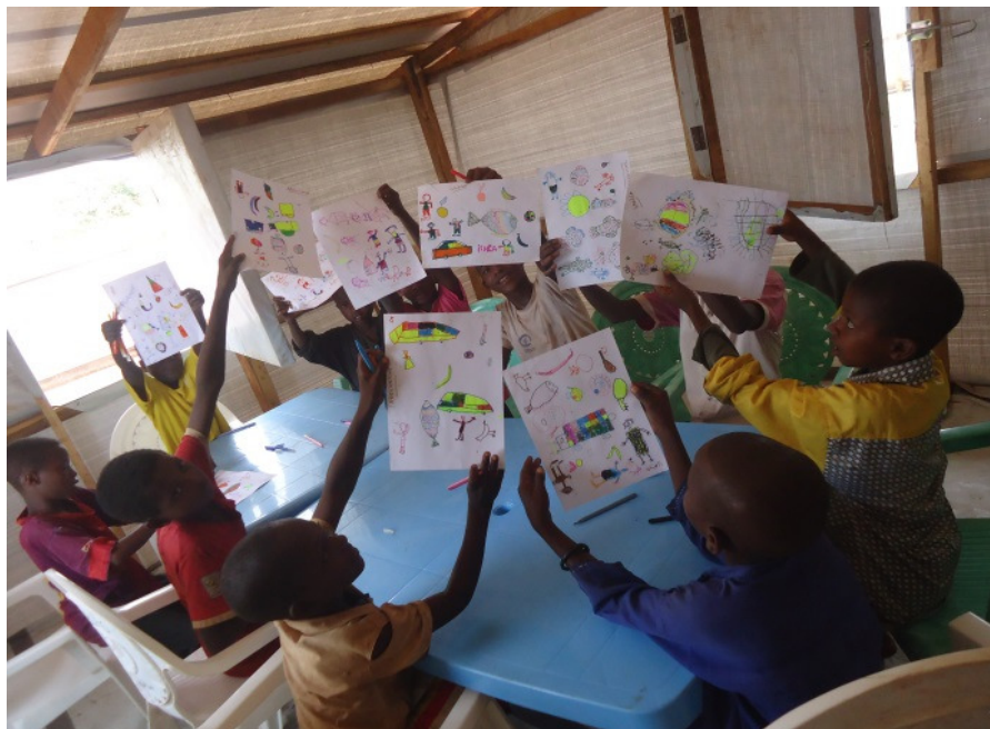
Activité psychosociale menée par CARE avec les enfants réfugiés du site de Mbile.