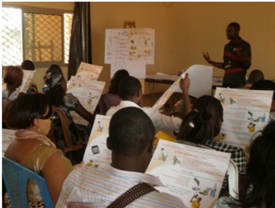
Formation des relais communautaires et personnel de santé en surveillance épidémiologique par l'OMS à Garoua Boulai .