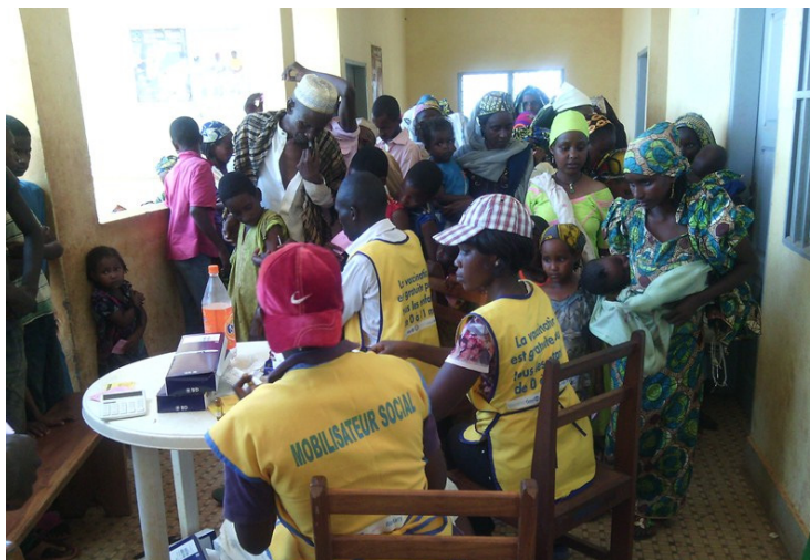
Poste de vaccination contre la Fièvre Jaune au CSI de Mbilé.