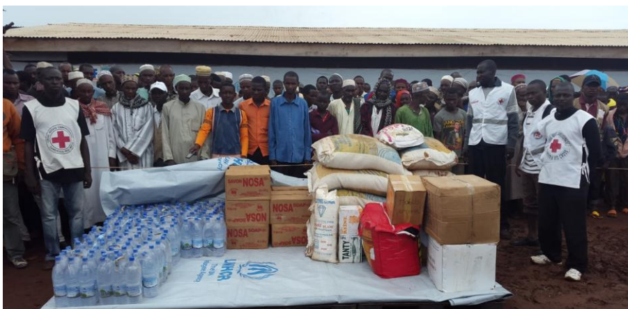
Don du personnel de MinRex, exposé sur le site de Mbile.