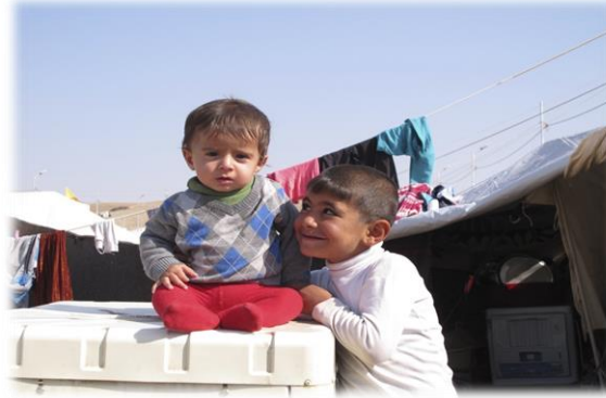
السكان اللاجئون في العراق:

ويعتبر الاستعداد للسكان اللاجئين المتزايدين ونتائج من التدفق الجماعي ذو أولوية رئيسية. وتواصل القطاعات المحافظة على التطعيمات المستهدفة لجميع اللاجئين القادمين حديثاً. ويجري تحديث خطط للطوارئ للاستجابة إلى حالة التدفق الجماعي.