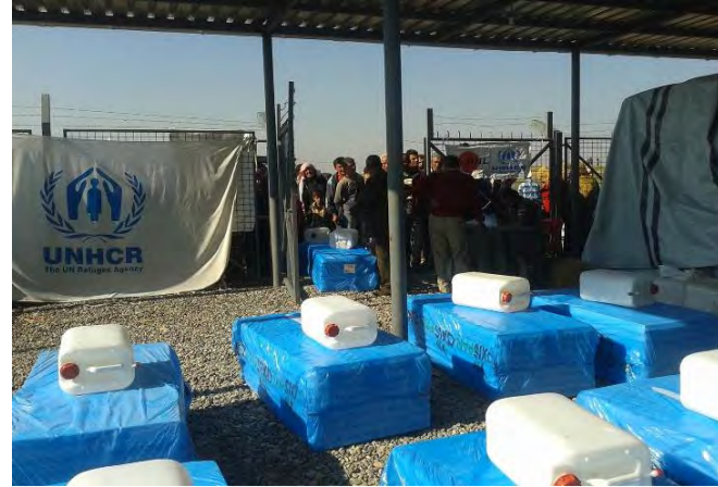
توزيع مواد الاستعداد لفصل الشتاء في كاويلان، تشرين الثاني-المفوضية

بدأت عملية توزيع مادة النفط في مخيمات دهوك في ١٧ تشرين الثاني، حيث وصلت الى ٦ آلاف و ٢٣٢ عائلة في مخيمي دوميذ وگاويلان وإلى ٢٦٤ عائلة في مخيم عقرة لغاية ٣٠ تشرين الثاني. وتسلمت العوائل برميل ملء بحوالي ٢٢٠ لتراً من النفط، بينما تسلمت العوائل في عقرة ٢٠ لتراً اسبوعياً.