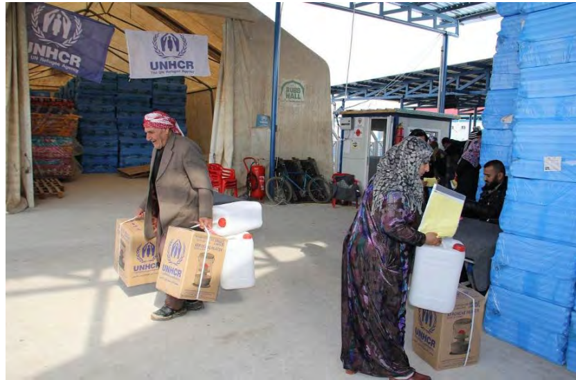
توزيع مواد الاستعداد لفصل الشتاء في دوميذ، ٢٣ تشرين الثاني - المفوضية

بدأت المرحلة الثانية من توزيع مجموعة لوازم الاستعداد لفصل الشتاء (المكونة من ألواح البوليسترين العازلة وصفائح خزن النفط) في ١٩ تشرين الثاني في مخيم غاويلان. كما استلم الأفراد