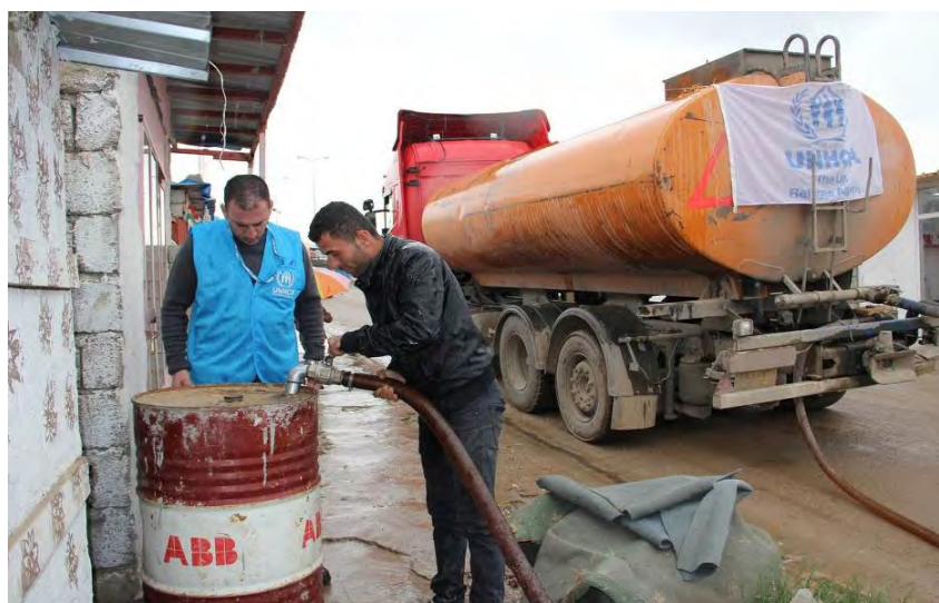
توزيع مادة النفط في مخيم دوميز ، تشرين الثاني