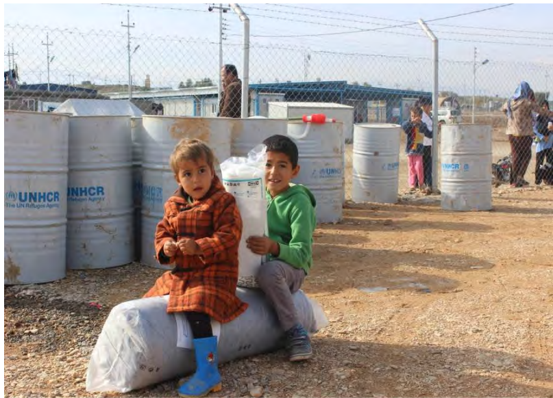
توزيع مؤسسة إيكيا لأطقم الفرش والنفط في مخيم عربت للاجئين: مواد الاستعداد لفصل الشتاء الأكثر ضرورة مع تحول الجو الى البرودة - YAO