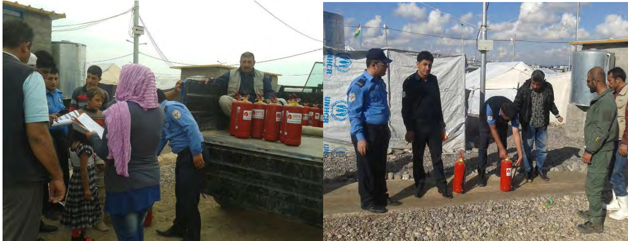
توزيع مطافي الحريق والتدريب عليها في گاويلان، تشرين الثاني ٢٠١٤ -المفوضية