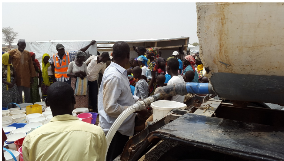
L'accès à l'eau au camp de Minawao reste un véritable défi. Ici, MSF approvisionnant le camp en eau par camion-citerne.