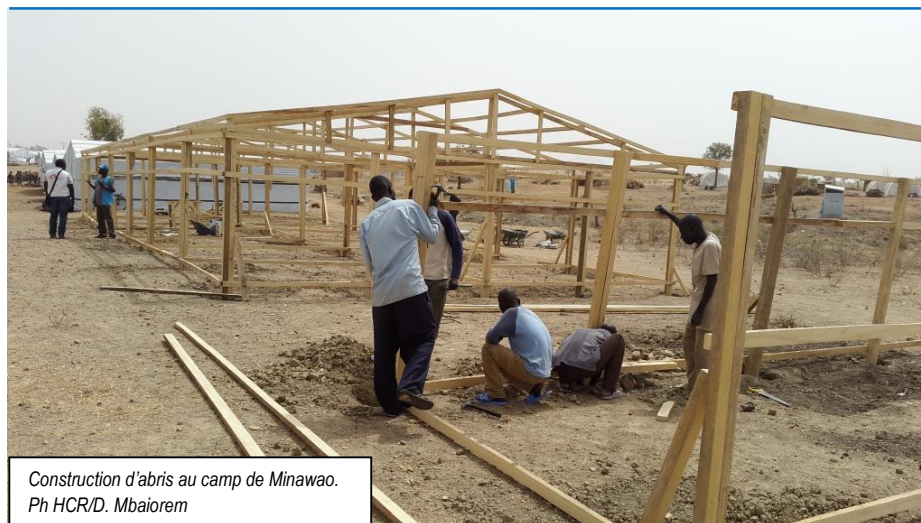
Construction d'abris au camp de Minawao.