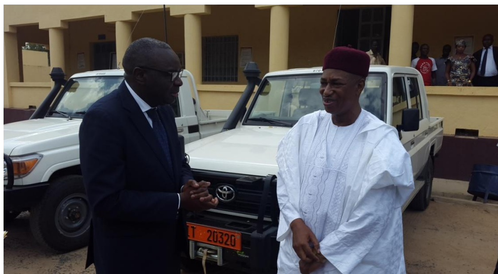
Le Représentant du HCR et le Gouverneur de la région de l'Extrême Nord, lors de la cérémonie de remise des véhicules.