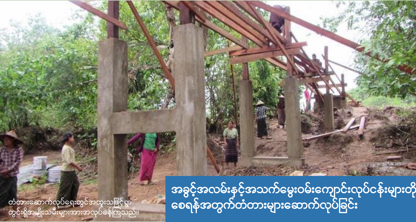
တံတားဆောက်လုပ်ရေးတွင်အထူးသဖြင့်ရွာတွင်းရှိအမျိုးသမီးများအားအလုပ်ခန့်ကြသည်။