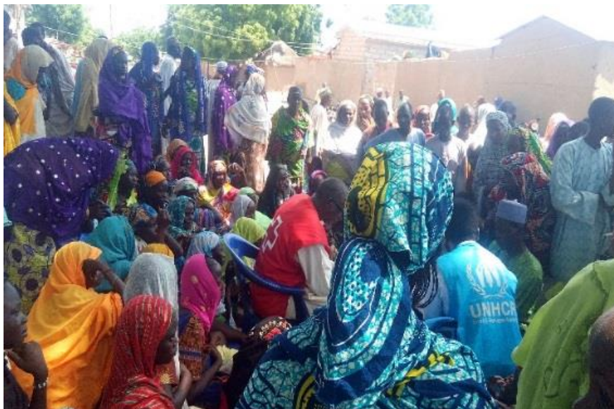
Enregistrement des PDI à Mémé.