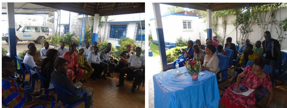
La Représentante du HCR au Togo s'adressant aux leaders des réfugiés vivant à Lomé

Le 16 Novembre 2017, la Représentante a rencontré les leaders des réfugiés vivant à Lomé. Après avoir annoncé son départ du Togo, elle a remercié ces leaders pour leur franche collaboration avec le HCR. Elle a exhorté encore une fois, les réfugiés au choix d'une solution durable surtout entre le rapatriement volontaire et l'intégration locale, la réinstallation devenant de moins en moins possible.