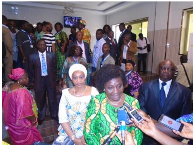
La Ministre de l'Action Sociale, de la Promotion de la Femme et de l'Alphabétisation, Mme Tchabinandi Kolani Yentcharé livrant son mot à la presse après l'ouverture du forum