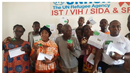
Les Personnes à Besoins Spécifiques (PBS) du camp des réfugiés ivoiriens d'Avépozo après la distribution des cartes bancaires CASH EXPRESS de l'approche CBI au Togo