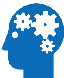
Προβλήματα ψυχικής υγείας