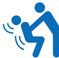
Σεξουαλική και έμφυλη βία