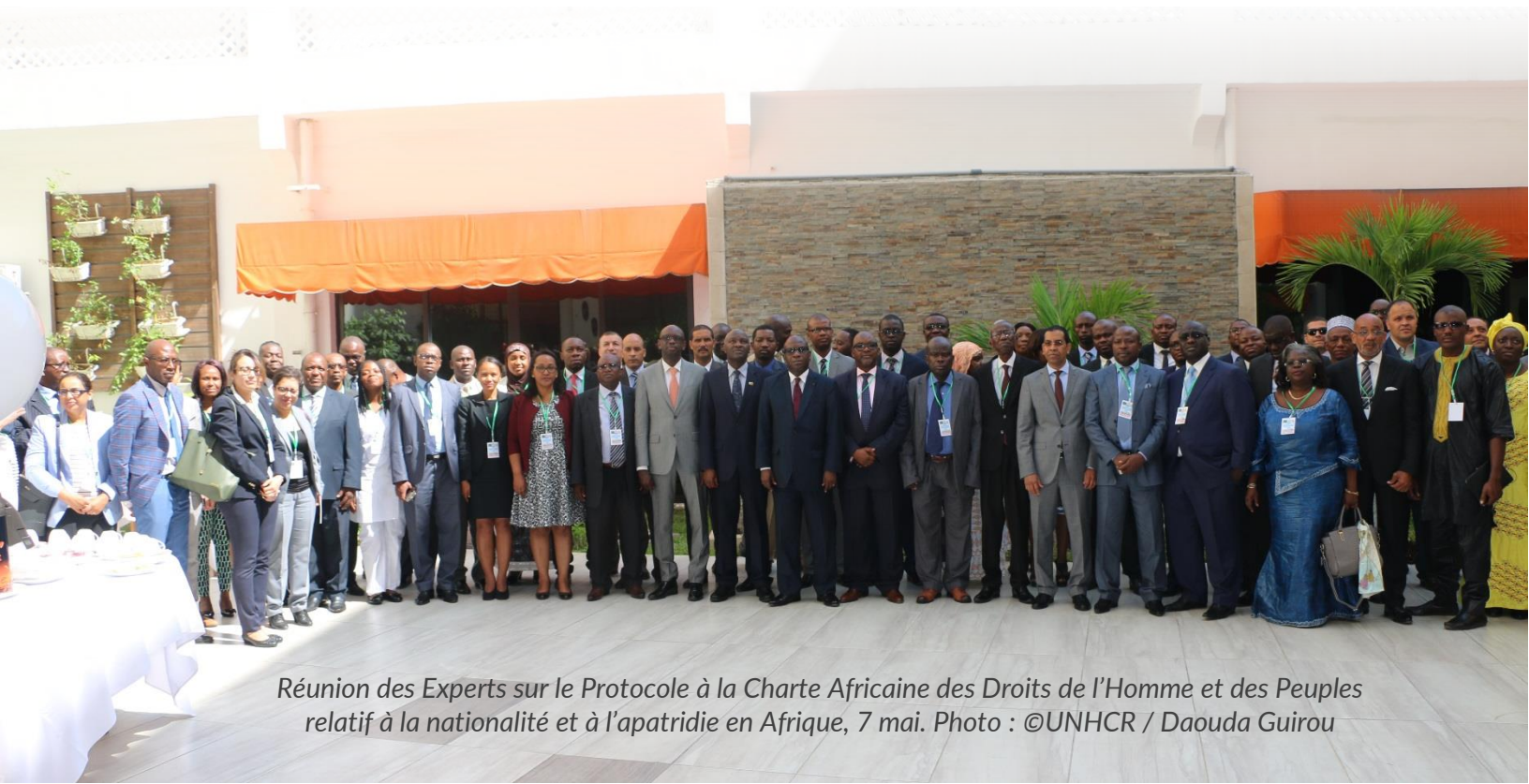
Réunion des Experts sur le Protocole à la Charte Africaine des Droits de l'Homme et des Peuples relatif à la nationalité et à l'apatridie en Afrique, 7 mai.