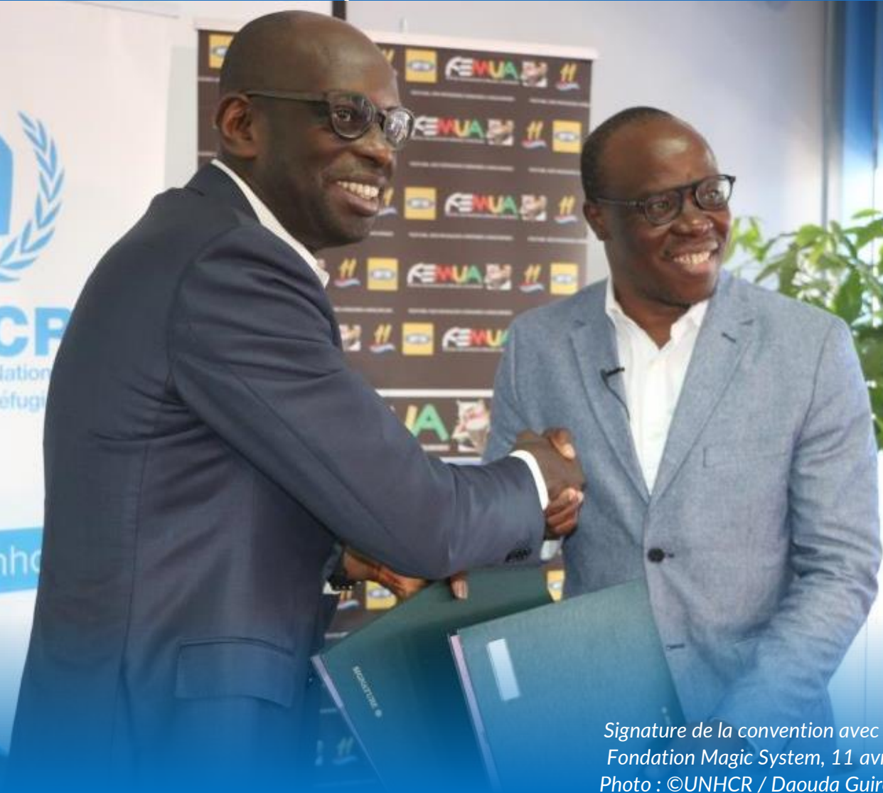
Signature de la convention avec la Fondation Magic System, 11 avril