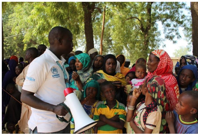
Le partenaire Intersos continue son œuvre de mobilisation communautaire.