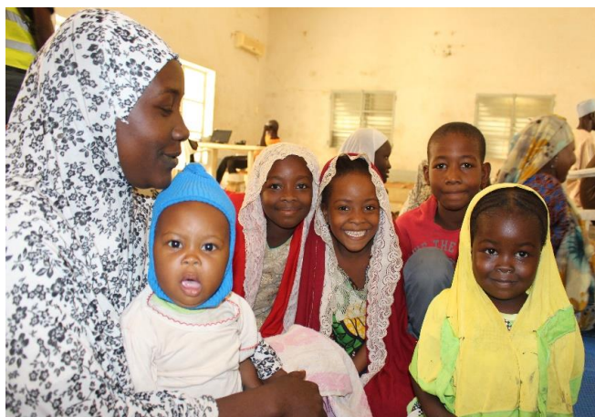
Une famille de réfugiés venus se faire enregistrer.