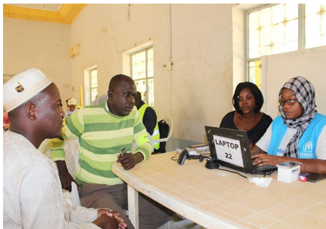
Une famille de réfugiés venus se faire enregistrer.