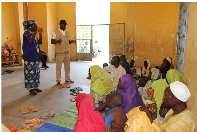
Session de sensibilisation pré enregistrement par le HCR et son partenaire Intersos à Kousseri.