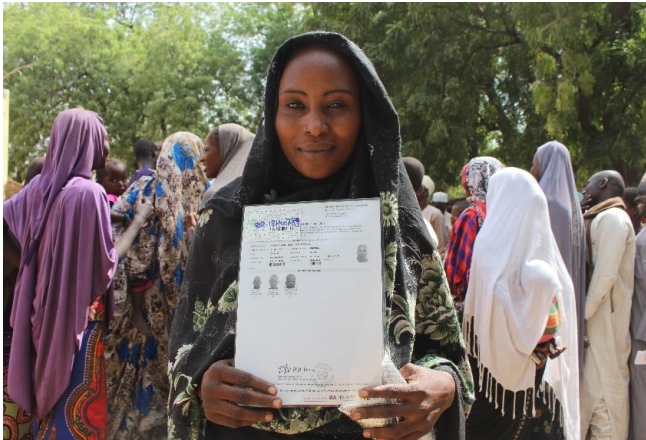
Heureux d'avoir reçu leurs attestations.