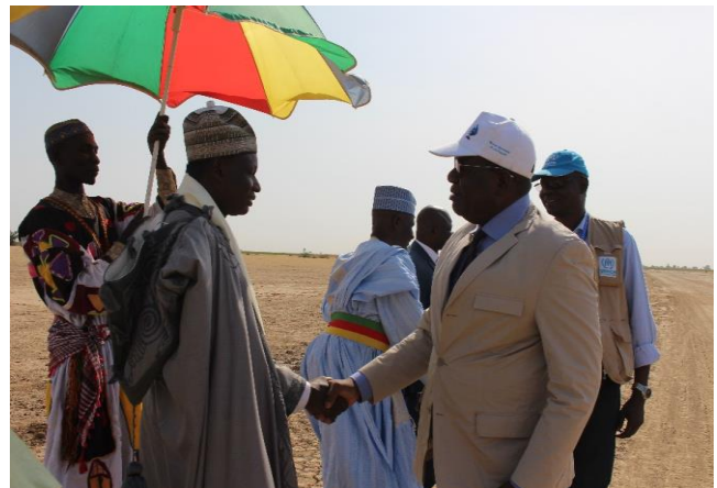
Les hommages à Sa Majesté le Sultan d'Adé.