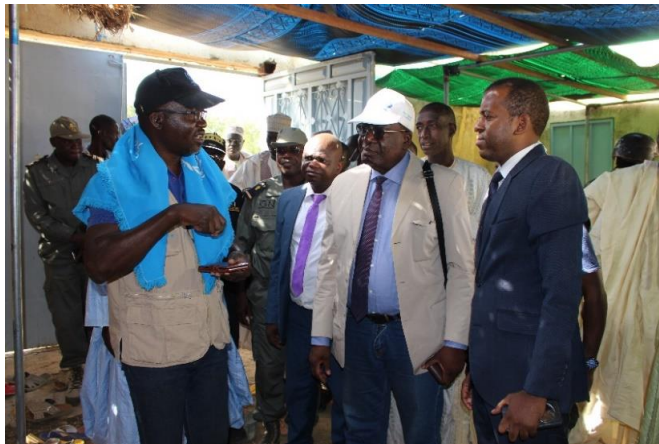
Le circuit de l'enregistrement biométrique expliqué.