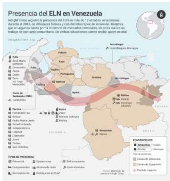
Mapa 1 Presencia del ELN en Venezuela. Fuente: inSight Crime. Noviembre 2018.

Según información recolectada por inSight Crime, el ELN habría ampliado su presencia a 12 estados de Venezuela. Las últimas acciones armadas, en las cuales 3 miembros de la Guardia Nacional Venezolana murieron y 10 mas resultaron heridos en el Estado de Amazonas como respuesta a la captura de 4 de sus integrantes el 4 de noviembre, se suman a una sería de acciones armadas en territorio venezolano, las cuales ya no solo se limitarían a la zona limítrofe donde históricamente han hecho presencia los grupos