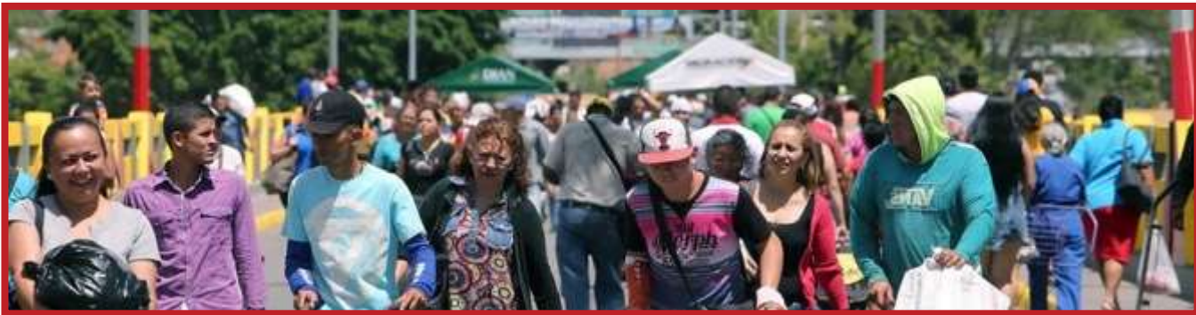
Población Venezolana radicada en Colombia por rangos de edad y género a septiembre de 2018