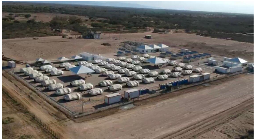
El Centro de Atención Integral en La Guajira

Durante el mes de marzo, 34 organizaciones del GIFMM y sus socios implementadores brindaron asistencia humanitaria en 9 sectores, incluidos prestación de servicios básicos de salud, alojamiento temporal, agua y saneamiento, seguridad alimentaria y nutrición y transporte humanitario. Los miembros entregaron asistencia en 58 municipios de 13 departamentos.