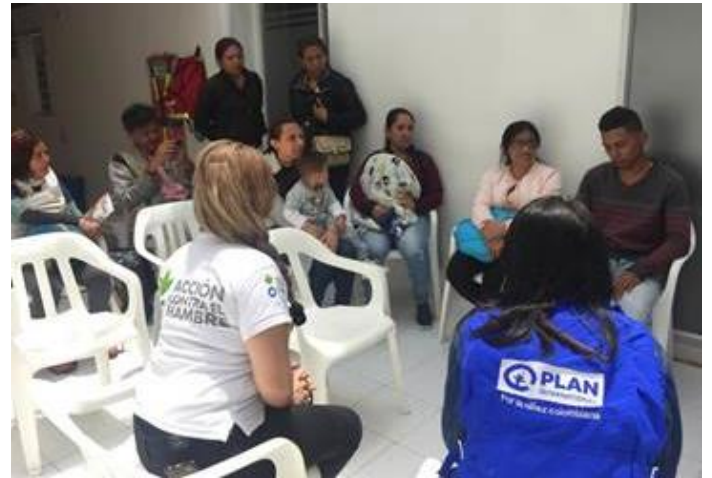
Un taller en Bogotá sobre salud sexual y reproductiva con venezolanos recién llegados, en el Centro Integral de Atención al Migrante

Entre los riesgos de protección que enfrentan las personas que llegan de Venezuela la violencia basada en el género es un riesgo para adultos y niños, niñas y adolescentes durante el ingreso o tránsito por Colombia. Para garantizar su integridad y el desarrollo, los miembros del GIFMM aseguraron que 578 casos de víctimas venezolanas de violencia de género accedieran a rutas de prevención y atención en 6 departamentos. Por otro lado, más de 6,200 niños y adolescentes se beneficiaron de entornos protectores, en los cuales pudieron estar en entornos seguros recibiendo atención básica y actividades educativas y de uso del tiempo.