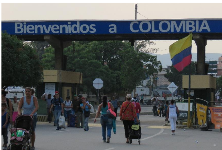
El cierre oficial de los cruces fronterizos oficiales da como resultado el aumento de población ingresando por cruces irregulares, muchos de ellos inseguros