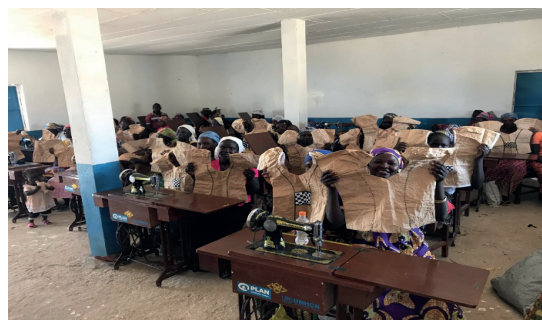
Formation en couture - Camp de Minawao - septembre 2019