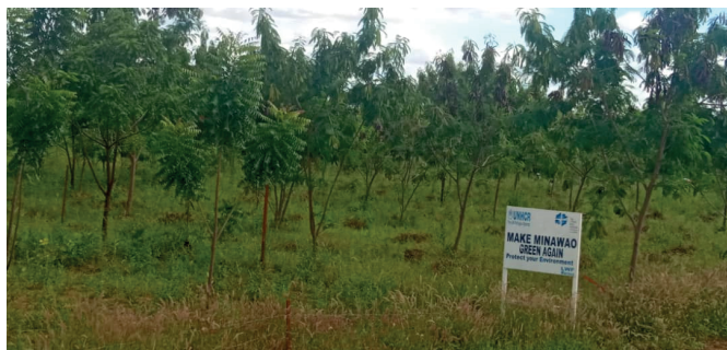
Espace de reboisement - Camp de Minawao - septembre 2019