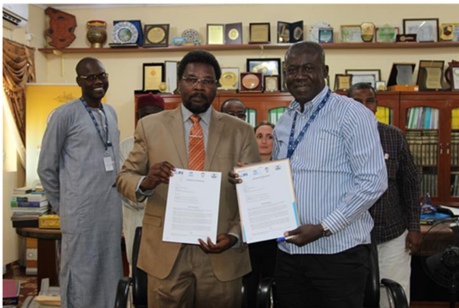
Signature d'une convention de partenariat avec l'université Roi Fayçal le 2/2/2020 à N'Djamena

Au Tchad , une convention de partenariat a été signée avec l'université Roi Fayçal accordant une réduction de 50% sur les frais de santé à 140 boursiers DAFI et une autre avec le Centre d'Apprentissage de Langue Française (CALF) pour une formation certifiante pour 101 boursiers DAFI Arabophones .