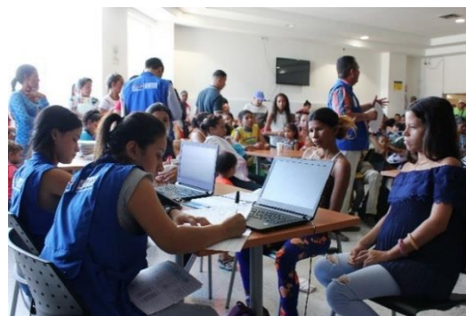
Jornada de entrega de vouchers de alimentos en Cúcuta, Norte de Santander.

*Aquellas entre paréntesis corresponden a socios implementadores.