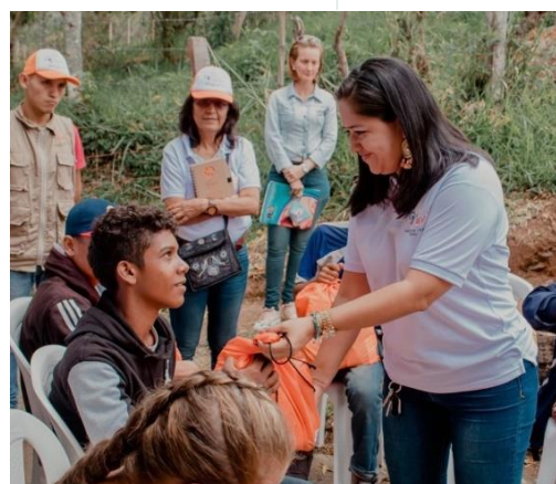
Entrega de kits viajeros a refugiados y migrantes en tránsito en Valle del Cauca.

Más de 5.900 refugiados y migrantes recibieron asistencia, representación o asesoría legal. Por último, más de 800 personas recibieron servicios de información, prevención y respuesta ante violencias basadas en género, mediante iniciativas de fortalecimiento comunitario y orientación sobre rutas de protección, entre otras acciones; de igual manera, 364 personas fueron capacitadas en esta materia.