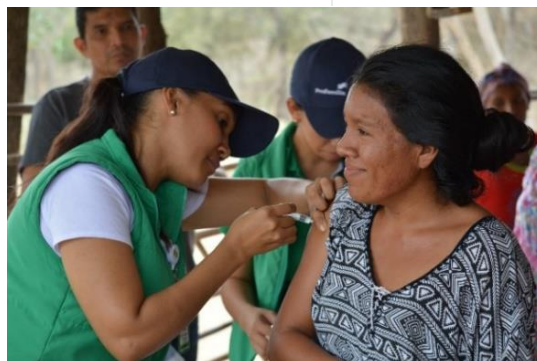
Jornada de vacunación en Riohacha, La Guajira.

Durante el mes de enero, más de 60.000 beneficiarios recibieron una o más asistencias a través de 26 socios e implementadores del RMRP, en 20 departamentos y 36 municipios, tanto en departamentos de frontera como de tránsito y asentamiento de población proveniente de Venezuela. Se realizaron más de 41.500 consultas de atención primaria en salud física y mental y más de 3.600 consultas de atención de emergencia para refugiados y migrantes, incluyendo partos y atención neonatal; además, más de 8.500 personas recibieron atención en salud mental o apoyo psicosocial. En cuanto a salud sexual y reproductiva, se realizaron más de 3.200 atenciones médicas, integrales y ginecológicas prenatales.