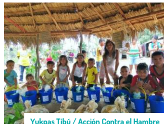
Yukpas Tibú / Acción Contra el Hambre

6.899 kits de higiene entregados, destacándose los de aseo, hábitat y para NNA.