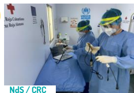
NdS / CRC

131 Entregas al HUEM en equipos como ventiladores mecánicos (3), respiradores (2), carpas Huggy PRO (2), Refugee Housing Units (32), escritorios y demás elementos para facilitar la atención (92).