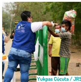
Yukpas Cúcuta