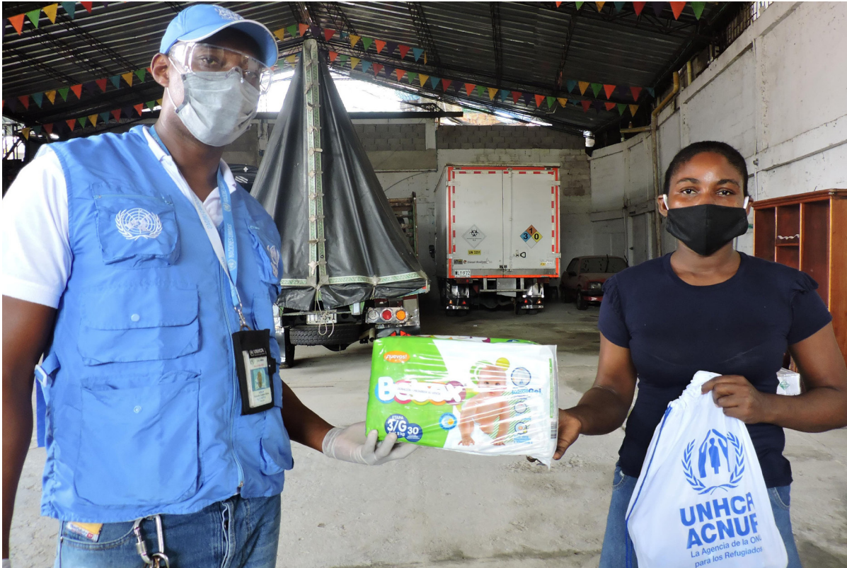
ACNUR en Quibdó, Chocó, entregó 27 kits de bebé a familias de refugiados y migrantes venezolanos que perdieron sus fuentes de ingreso debido a la emergencia de COVID-19.