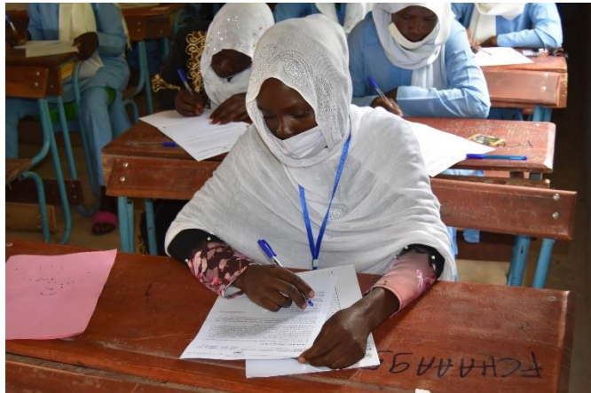
Vue des candidats dans la salle d'examens

de soulagement pour des centaines de jeunes réfugiés et tchadiens de Farchana qui parcouraient plus de 60 km pour aller composer à Hadjer Hadid (province de Ouaddaï, département d'Assongha).