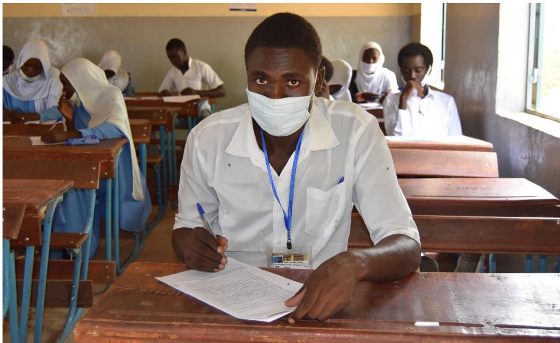
Vue des candidats dans la salle d'examens