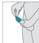
Saque el aire que se encuentre en la punta del condón.