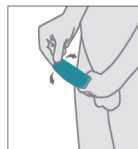
Desenrolle el condón hasta la base del pene.