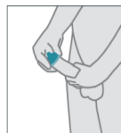
Coloque el condón en la cabeza del pene erecto y firme. Si está circuncidado, primero retraiga el prepucio.