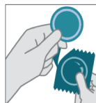
Abra y retire el condón de su envoltura con cuidado.

Durante la movilización de personas pueden incrementarse las relaciones sexuales, por lo que te recomendamos usar condón SIEMPRE para evitar infecciones de transmisión sexual, incluyendo el VIH/SIDA y también evitar embarazos no deseados. Es tu derecho pedirle a tu pareja que use condón.